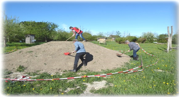
Eine Warft als Blühfläche ca. (125 qm)