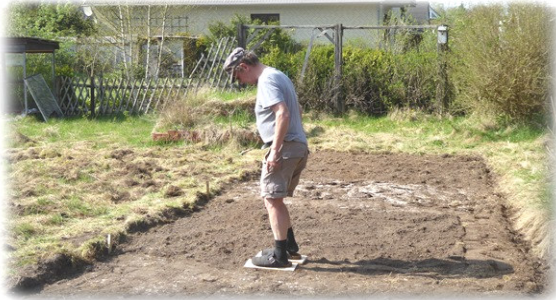
Ca. 125 qm Fläche mit aufgetragenem und vermischtem Magersand im stillgelegten Kleingarten.