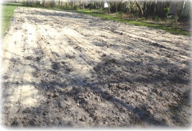
Bei sehr fetten Böden ggf. gewaschenen Sand auftragen