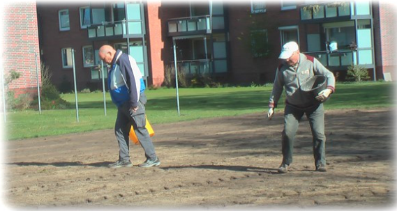
Saat manuell aufbringen

....dass sich etliche Personen von umliegenden Landwirten gegen eine kleine Gebühr -oder auch ehrenamtlich- Hilfe bei der Bodenbearbeitung geholt haben? Fragen Sie doch mal nach!