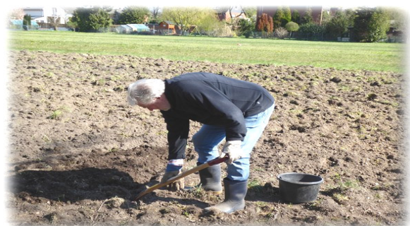
Größere Steine bitte einsammeln