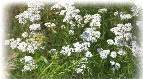
Knoblauchsrauke, Schafgarbe, Wilde Möhre und Co. sind bei Insekten und Wildbienen äußerst beliebte mehrjährige Wildpflanzen.