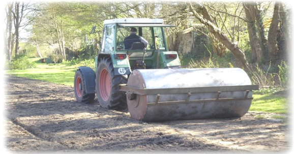
wieder den Boden anwalzen!