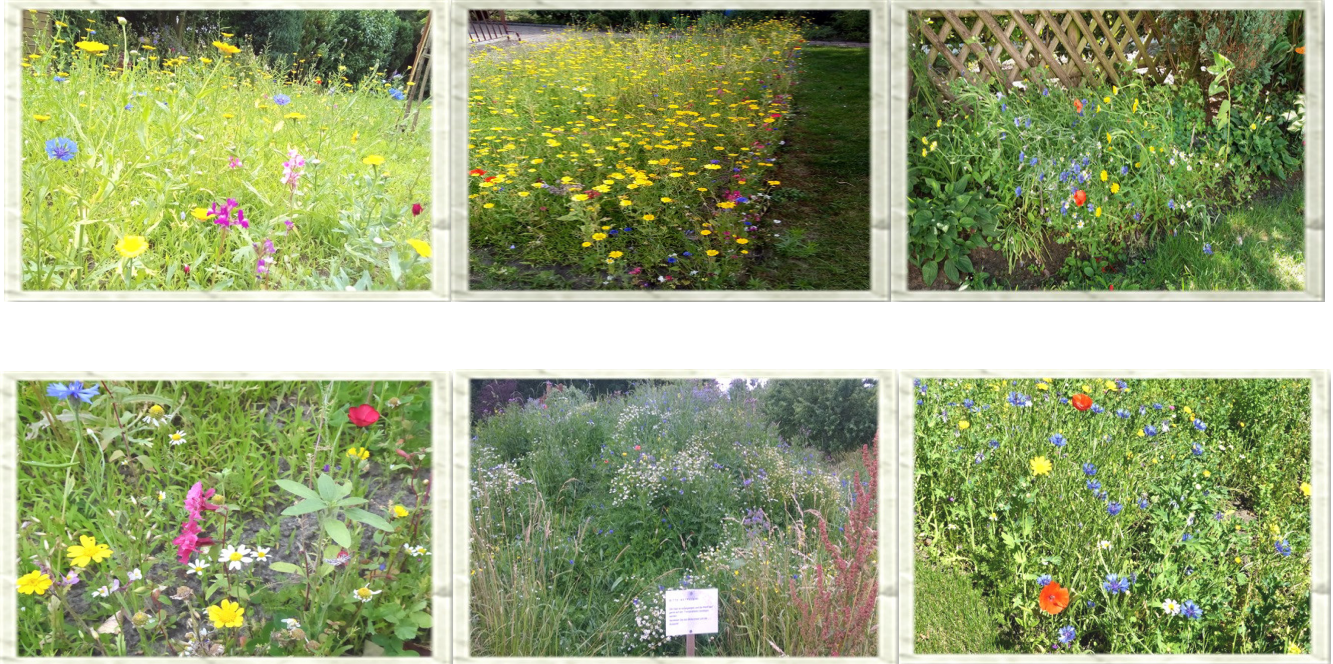
Die Blühergebnisse der jeweiligen Arten - je nach aufgetragener Saatmischung - hängen u.a. sehr von den jeweiligen Bodenverhältnissen, der Bodenvorbereitung sowie der Witterung nach der Aussaat ab.