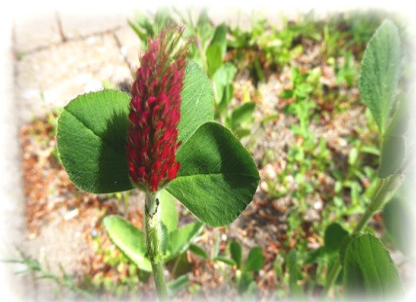
Inkarnat- (Blut-) Klee