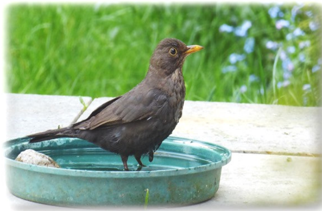
und die Amsel gesellt sich zum Wasserbaden und -trinken dazu.