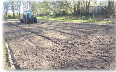
Anwalzen vor dem Aufbringen der Saat