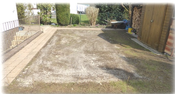
Beispiel: Privatfläche 35 qm, mit Magersand vermischt