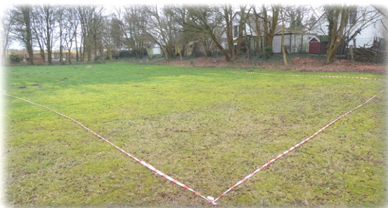
Fläche für den Maschineneinsatz gut sichtbar abgrenzen