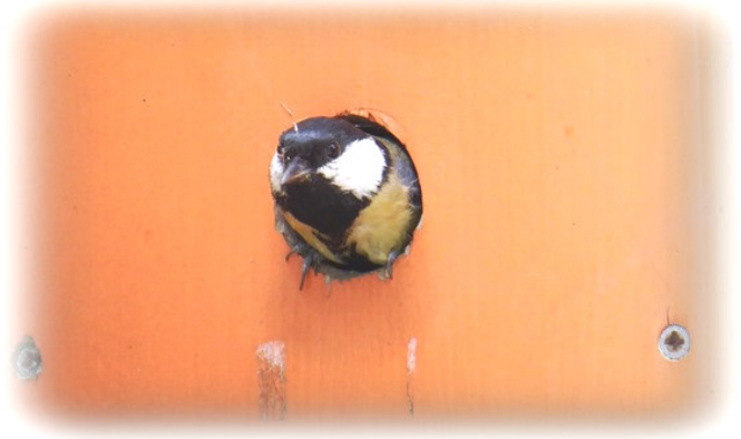
belegt mit einer Kohlmeise