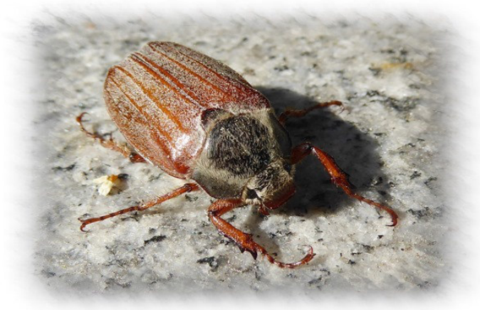
Auch der Maikäfer ist in Sicht