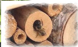
<<<<< Ein Gast

Ein feinmaschiger leichter Drahtzaun könnte ggf. Vorder- und Rückseite abdecken und bewahrt die Larven, Eier und Puppen vor den Vögeln. Allerdings ist diese Maßnahme umstritten: denn, wenn sich die Vögel dort mit Nahrung bedienen, ist es Natur.